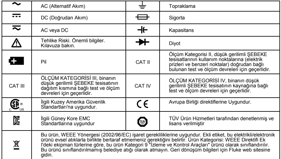
Tablo 1. Semboller