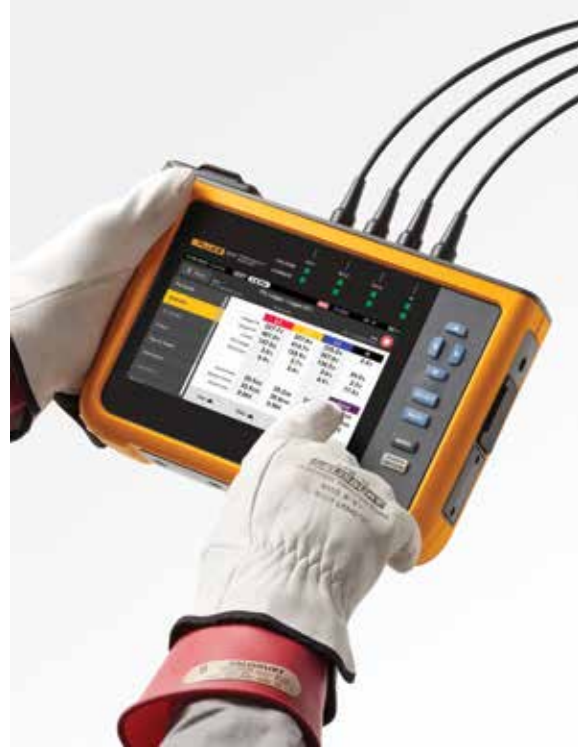
Büyük renkli dokunmatik ekran kullanarak kolayca gezin

Fluke 1770 Serisi Güç Kalitesi Analizörlerinden veri indirirken ürünle birlikte sunulan Energy Analyze Plus yazılım paketi, ölçülen gerilim ve akım harmonikleri ile ilgili istatistiksel verileri EN 50160 veya IEEE 519 gibi farklı standartlarla karşılaştırarak uyumluluk sınırlarının aşıp aşılmadığını belirleyebilir. Bu güçlü öngörücü bakım özelliği, akım harmoniklerinin gerilimde bozulma meydana gelmeden önce gözlemlenmesini sağlayarak beklenmeyen arızaları veya uyumsuzluk durumlarını önlemenize olanak tanır ve sistemin çalışma süresini artırır. İnverter tabanlı yüklerin ve güç üretiminin yaygınlaşmasıyla birlikte akım harmoniklerinin kontrol altında tutulması, güvenilir güç kalitesi sağlamak ve sistemin durmasını önlemek için giderek daha kritik hale gelmektedir.