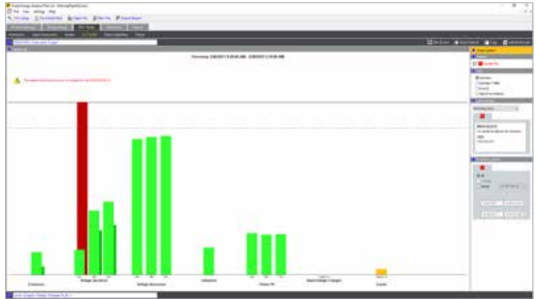
Fluke Energy Analyze Plus: Güç kalitesi durumu özeti