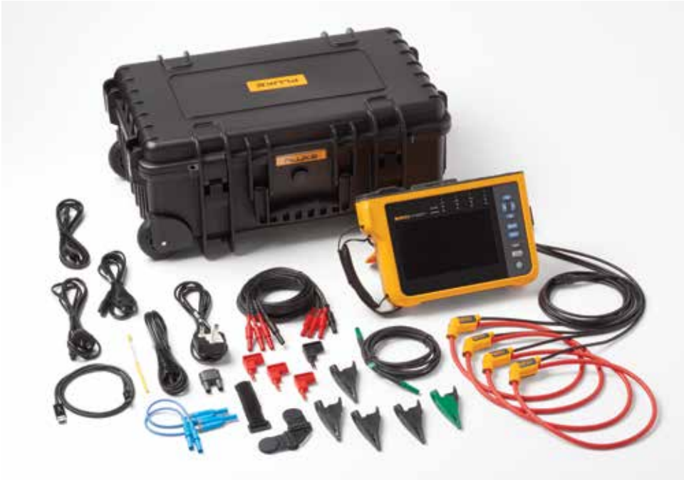
Fluke 1777 Güç Kalitesi Analizörü. Not: Pakete dahil edilen ürünler modele göre değişir ve "Sipariş bilgileri" tablosunda listelenir.